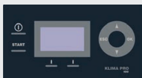
Программное управление KLIMA PRO

Все технологические процессы под контролем